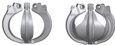
halboffen (HO) halbgeschlossen (HG)