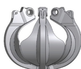
Semi-ouvert (HO) Semi-fermé (HG)